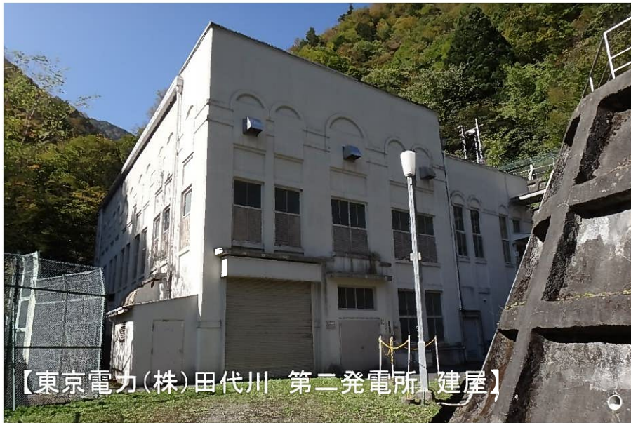
【東京電力(株)田代川 第二発電所 建屋】