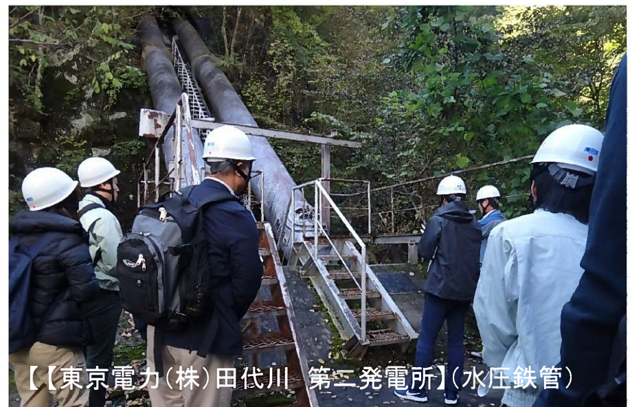
【東京電力(株)田代川 第三発電所】(水圧鉄管)