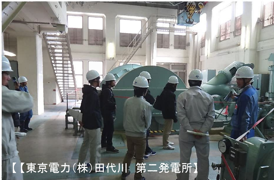
【東京電力(株)田代川 第二発電所】