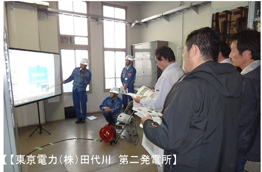
【東京電力(株)田代川 第二発電所】